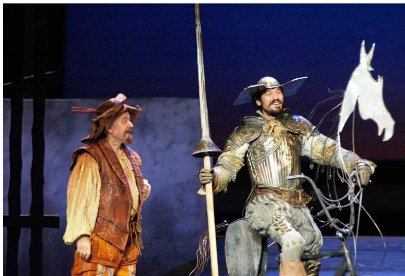
M. Bulgákov, Don Quijote , Teatro Madlenianum, Belgrado, 2005.