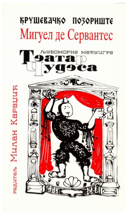
Cervantes, Teatro de las maravillas . Teatro de Kruševac, 1995.